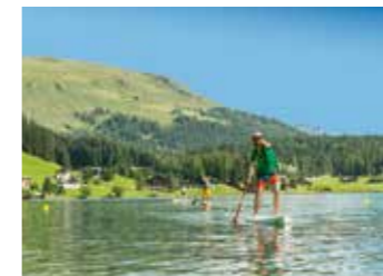
Davos Lake 水上运动