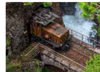
Zügen 峡谷 桥峰之巅 映入眼帘桥峰之巅