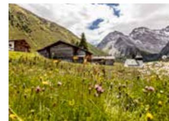
Sertig valley 塞蒂格峡谷