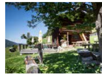
Gadawäg 乡味回心 提供中文语言导览