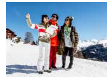
Foxtrail 全球首个中文狐狸小径