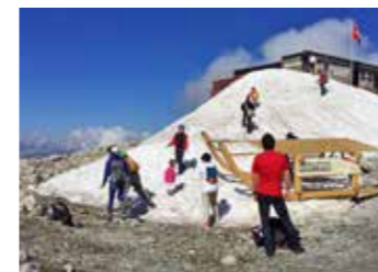
Parsenn peak 夏日趣玩雪 & 山峰之巅